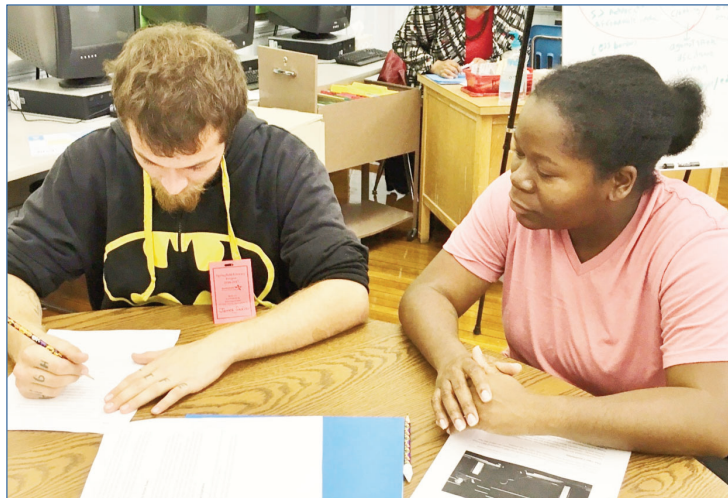
Un alumno adulto (izquierdo) y una tutor voluntaria (derecha) trabajan juntos durante una sesión de tutoría.

Los cocineros del cielo de LSG son una de las compañías de abastecimiento de la línea aérea más grande del mundo que también apoya operadores, minoristas ferroviarios y a la gestión del salón que ofrece una amplia variedad de soluciones de la comida del abastecimiento tradicional a las comidas congeladas y a los bocados embalados. LSG emplea a más de 1.000 empleados en la instalación de Des Plaines que abastece más de 600 nacionales diarios y los vuelos internacionales en el aeropuerto internacional de ÓHare. Los clientes notables incluyen las líneas aéreas unidas, de Virgin America, de Alaska, de COPA, de la frontera y del alcohol. La sociedad con el Instituto de Enseñanza Superior de Oakton proporcionó una oportunidad para que LSG ofrezca clases del ESL a los empleados no anglo. El intento de las clases era aumentar la capacidad inglesa de estos empleados así que podrían comunicar mejor con los supervisores así como los pares de habla inglesa nativos. Era también importante que los empleados aprenden prácticas de seguridad y puedan demostrar estas prácticas en caso de una emergencia. LSG divulga que las clases y el entrenamiento han dado confianza a los participantes, mientras que provee de muchos de ellos su primera oportunidad de asistir a clases del ESL aunque han vivido