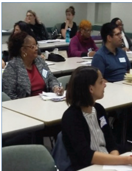
Los miembros de la coalición de instrucción en de Chicago obtendrán una donación en noviembre para un taller de escritura.

Miembros de la coalición de la instrucción en de Chicago recolecte en noviembre para un taller de la escritura de la concesión.