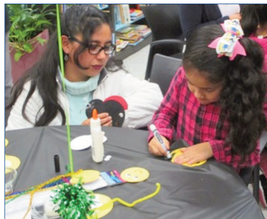
Una madre e hija participan en actividades de instrucción de familia en el Aquinas Literacy Center en Chicago.

$1.064.580 concedidos a 24 proyectos que proporcionan padres y a niños – individualmente y junto – los servicios educacionales para aumentar su lectura básica, matemáticas, escritura o conocimientos lingüísticos. Las concesiones se conceden a las sociedades que incluyen