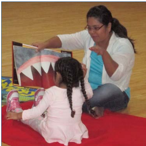
Una madre y una hija pasan tiempo jugando juntos durante las actividades de FRN en la YWCA Elgin.

Servicios humanos asiáticos – esta organización, situada en la vecindad del oeste de Ridge de Chicago, invitó a los sextos niños del grado que leyeron sus historias preferidas a niños más jóvenes y a padres. Las familias giradas a través de estaciones storytelling y también participaron en un arte que hacía proyecto. Sus opciones incluyeron la fabricación de marionetas o crear un llavero o una joyería.