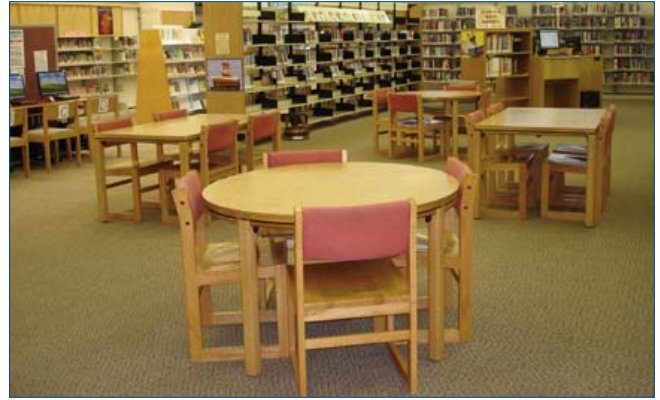
Los espacios de reuniones de la biblioteca se usan para educar adultos y a sus familias.

Los estudiantes y los profesores particulares tienen de fácil acceso a la impresión extensa y a los materiales audio-visuales de la biblioteca. Además, la biblioteca donó hola-lo los libros para proyectar la LECTURA. El personal de biblioteca ayuda a estudiantes a conseguir tarjetas y