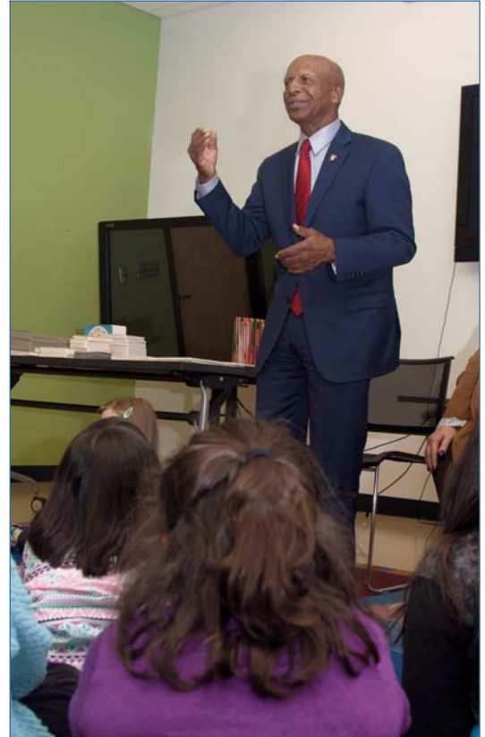
El Secretario White acoge con satisfacción a niños locales a FRN en Addison Public Library. Cada niño recibió un libro a la cortesía para llevar del ILF.