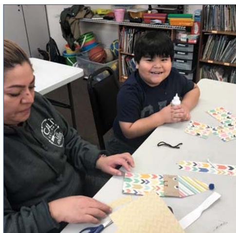
Una madre y un hijo se divierten haciendo artesanías durante las actividades de FRN en los Servicios Humanos Asiáticos.