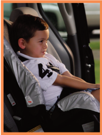
JESSE WHITE Secretary of State